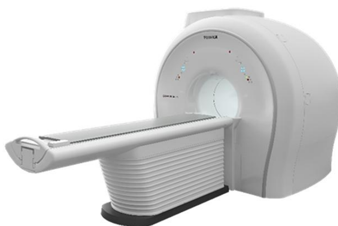
1.5テスラ超電導MRIシステム「ECHELON Smart Plus」

しんゆり脳神経外科クリニック(神奈川県川崎市)では、近隣の医療機関からの検査依頼をインターネット上で受け付ける医療機関向けサービスを2023年4月24日(月)、正式にスタートしました。